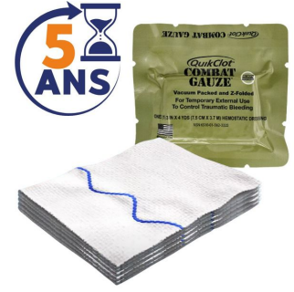
Péréption et garantie QuikClot Combat Gauze