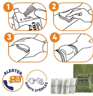
Comment utiliser QuikClot Combat Gauze ?