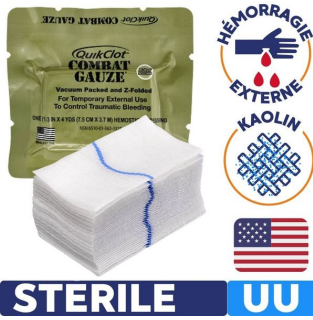
Pansement hémostatique QuikClot Combat Gauze pour hémorragie externe