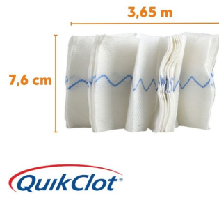
Dimensions QuikClot Combat Gauze