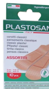
Pansements assortis Plastosan - Boite de 10