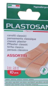
Pansements assortis Plastosan - Boite de 10