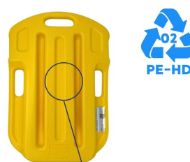
POLYÉTHYLÈNE HAUTE DENSITÉ

planche de réanimation polyéthylène haute densité