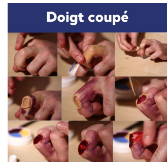
Maquillage couleur chair clair Plasto Nat Maqpro