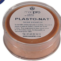
Maquillage couleur chair clair Plasto Nat Maqpro