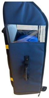
Sac oxygénothérapie avec poche DAE 68x29x24cm