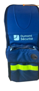
Sac oxygénothérapie avec poche DAE 68x29x24cm