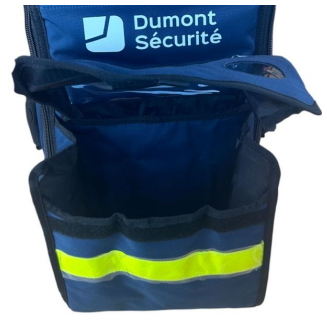
Sac oxygénothérapie avec poche DAE 68x29x24cm