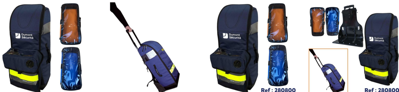
Sac oxygénothérapie avec poche DAE 68x29x24cm Sac oxygénothérapie avec poche DAE 68x29x24cm