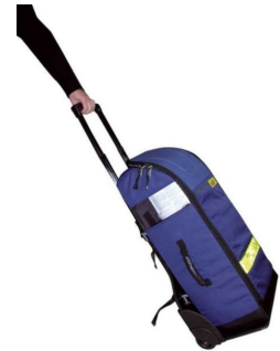
Sac oxygénothérapie avec poche DAE 68x29x24cm