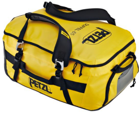
sac duffel 65l jaune