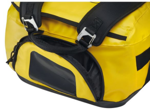
sac duffel 65l jaune