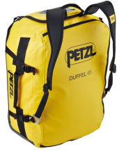
Sac de transport Duffel 65 L ultra résistant pour les pros