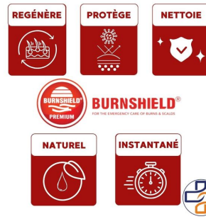
bienfait gel brulure burnshield