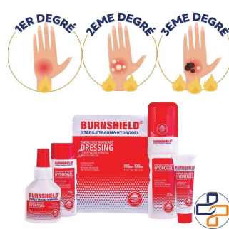
type de brulure soin burnshield