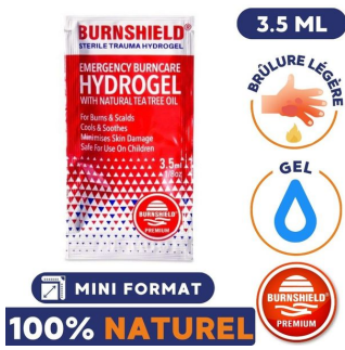
gel aloe vera brulure 3.5ml pour brulure légère burnshield 100% naturel