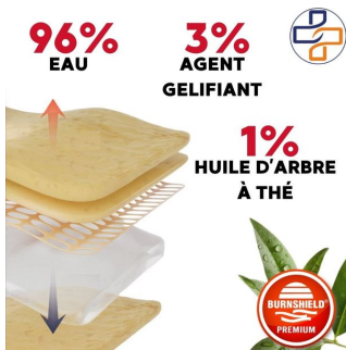
soin brulure 100% naturel