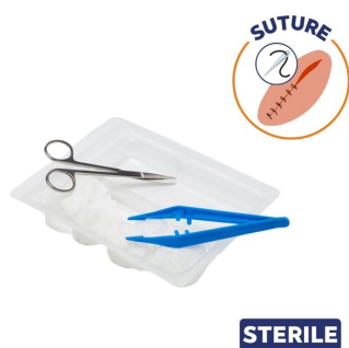
Kit stérile d'ablation de fils de suture avec coupe-fils