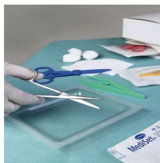
Kit stérile d'ablation de fils de suture avec coupe-fils