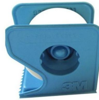
Sparadrap Micropore hypoallergénique blanc 3M - 2,5 cm x 9,14 m