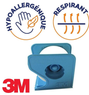
Sparadrap Micropore hypoallergénique blanc 3M - 2,5 cm x 9,14 m