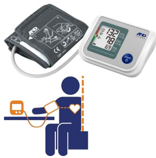
Tensiomètre brassard électronique UA767S IHB