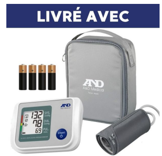
Tensiomètre brassard électronique UA767S IHB