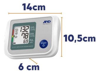
Tensiomètre brassard électronique UA767S IHB