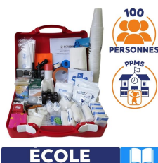
mallette ppms 100 personnes pour écoles