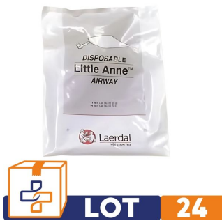
lot de 24 voies respiratoires pour mannequin Little Anne Laerdal