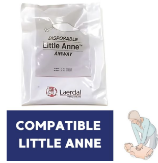
Voies respiratoires compatible mannequin Little Anne Laerdal