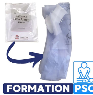
voies respiratoire pour mannequin de formation psc laerdal